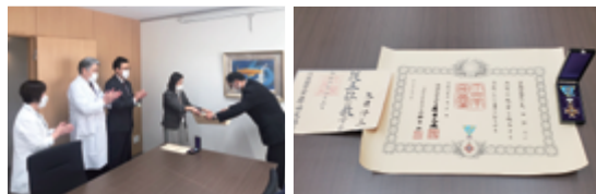
千葉県代表者より賞状を頂く 頂いた賞状および勲章